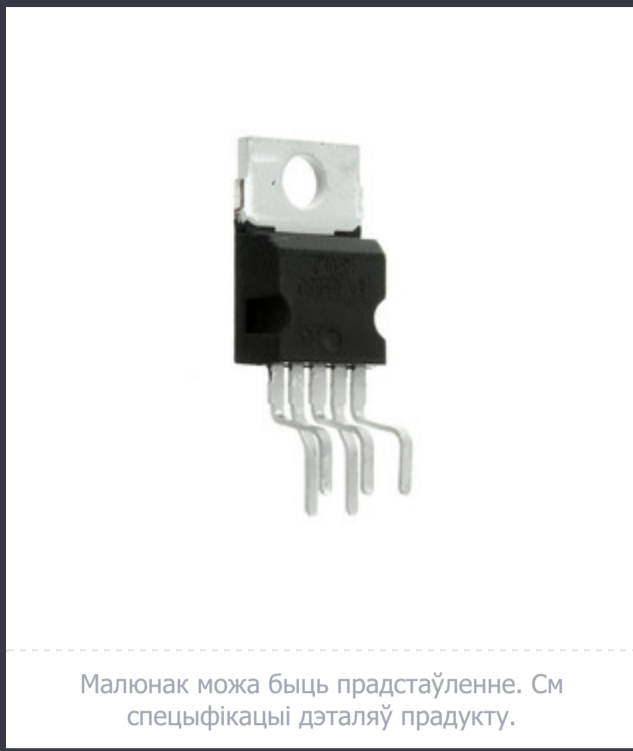
Малюнак можа быць прадстаўленне. См спецыфікацыі дэталю прадукту.