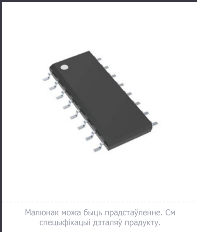
Малюнак можа быць прадстаўленне. См спецыфікацыі дэталю прадукту.